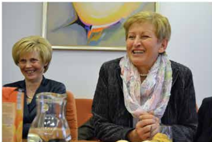
»Le kako naj ne bi bila nasmejana !?« Kostanji pred občino so se prijeli, služba na upravni enoti jo še vedno čaka, pa še predsednica občinskega odbora stranke Desus je postala.«