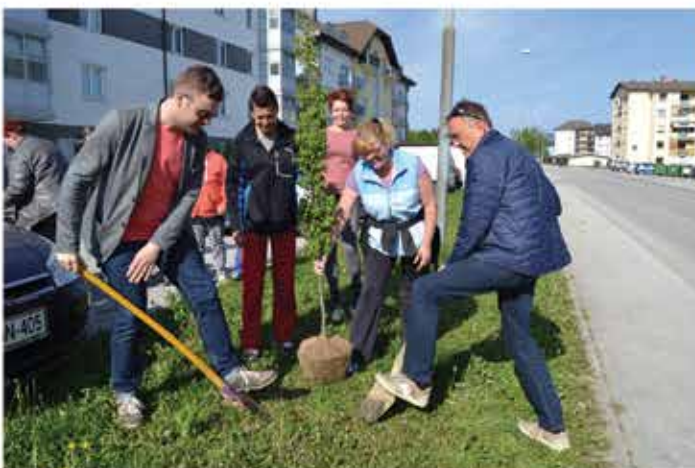
Motaln: »Jama mora biti okrogla !« Repolusk: »Ne, jama mora biti štirioglata !« Baza: »Ojoj, očitno bo treba sprejeti odlok.«