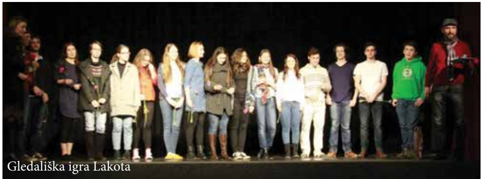
Gledališka igra Lakota