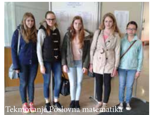
Tekmovanje Poslovna matematika