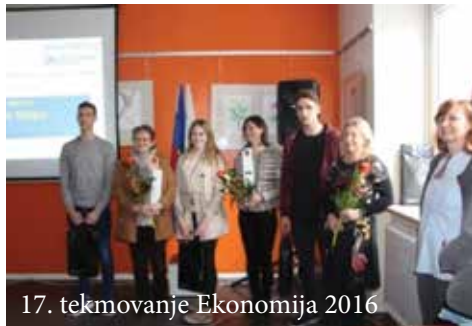
17. tekmovanje Ekonomija 2016

Posamezniki, ki znajo sprejemati izzive, se zavedajo, da bodo le tako lahko začutili pravo veličino uspeha. Ta misel neznane-ga avtorja dijakom Srednje šole Slovenska Bistrica pravzaprav nikoli ni bila uganka. Še več, v tem šolskem letu so ob že znanih vzniknila nova obetavna imena in utrdila ugled bistriške srednje šole v vsenarodnem in mednarodnem merilu.