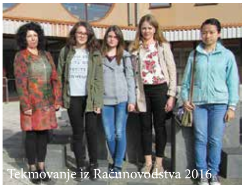
Tekmovanje iz Računovodstva 2016