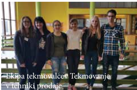
Ekipa tekmovalcev Tekmovanje v tehniki prodaje