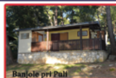
Banjole pri Puli