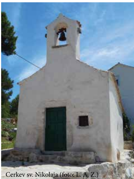
Cerkev sv. Nikolaja