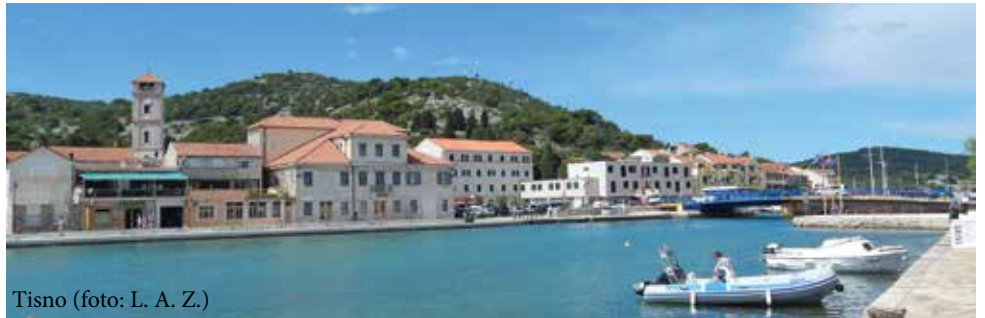
Tisno