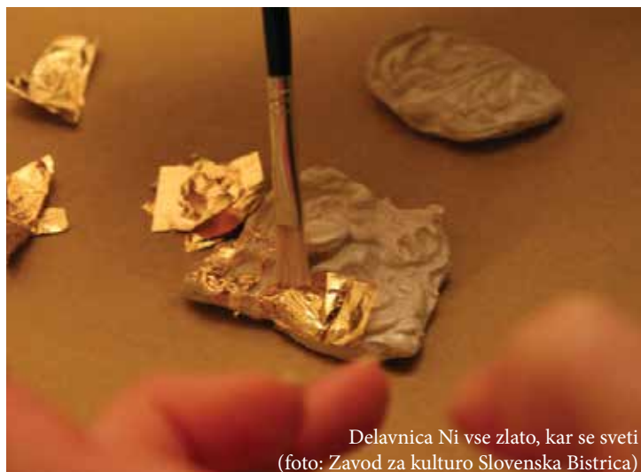
Delavnica Ni vse zlato, kar se vrti