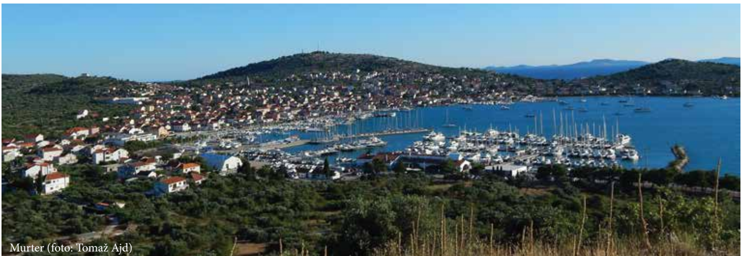
Murter

Naslednji dan smo se preselili v sosednjo občino Tisno. Najprej smo se srečali s predstavniki različnih organizacij in drug drugega seznanili z različnimi področji in dejavnostjo, ki jo opravljamo. Sprejeli so nas v prostorih tamkajšnjega