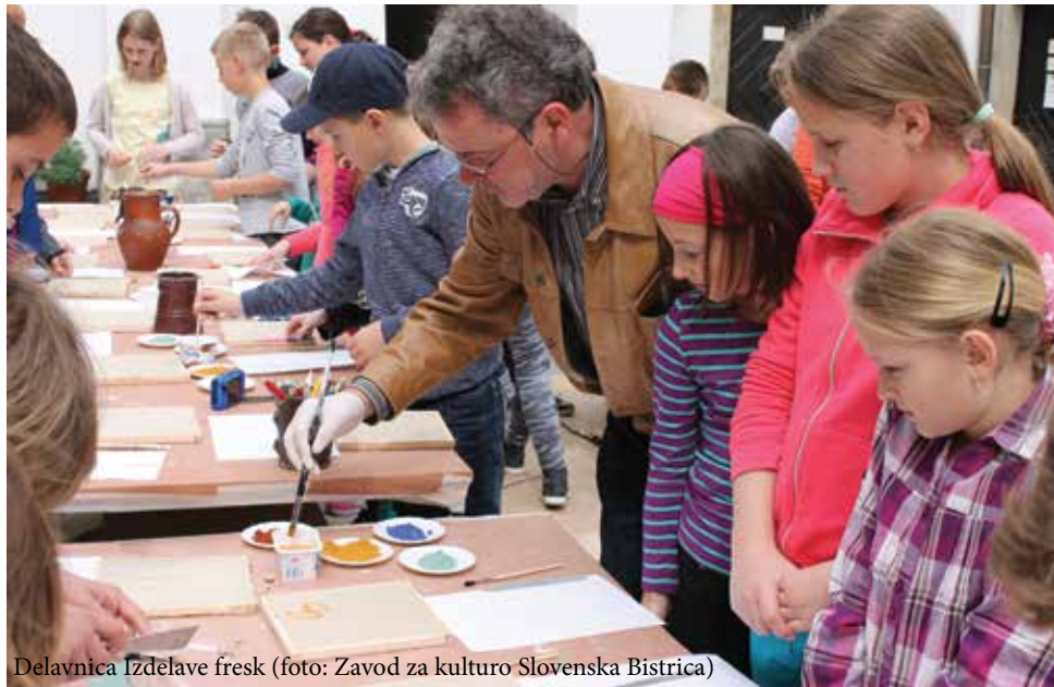
Delavnica Izdelave fresk

Nataša Gorenc, koordinatorica DEKD, Zavod za varstvo kulturne dediščine Slovenije