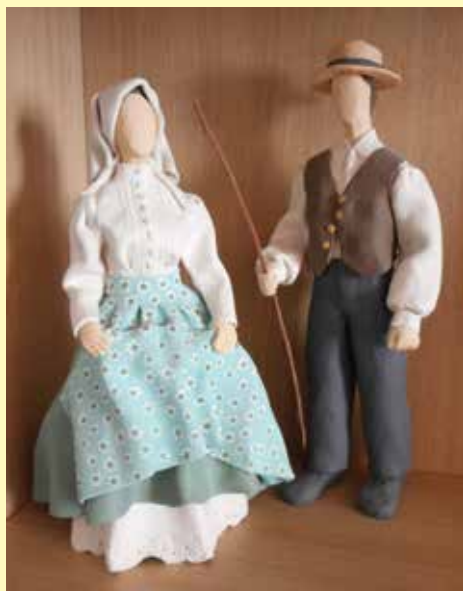
Par iz Makol, 19. stoletje