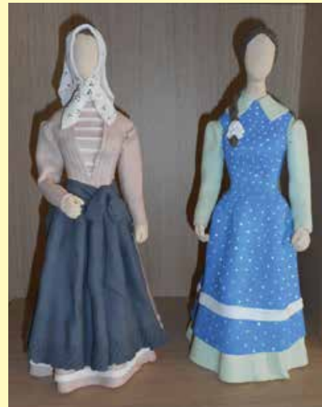
Starejša ženska in dekle s Tinja, 19. stoletje