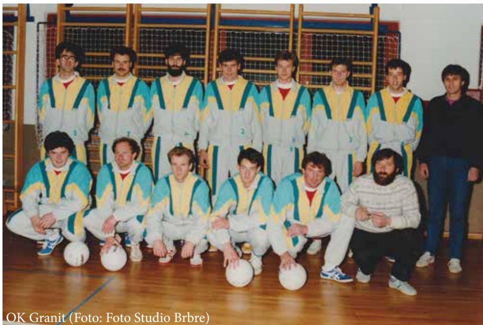
OK Granit

Največ pripomb so imeli klubi. Jasno je, da so zaradi ustanovitve zavoda nastali stroški, tako so klubi posledično izgubili del denarja za svoje dejavnosti. Skupaj z mano nas je zaposlitev dobilo osem, prej smo bili zaposleni samo trije. Zavod za šport je bil ustanovljen z namenom, da upravlja z objekti, ki so v lasti občine. Zato je bilo tudi zaradi novogradenj in obnov športnih objektov za športne dejavnosti manj denarja. V zadnjih letih so zadeve boljše urejene. Sredstva, ki jih na občinskem razpisu pridobijo klubi za vadbo v objektih, namreč sedaj neposredno nakažejo zavodu kot upravljavcu. Tudi sicer z zavodom zelo dobro sodelujemo. Tako tudi urna