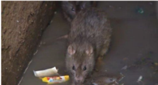
Podgana v kanalizacijskem sistemu v Tomšičevi ulici.

V mesecu oktobru in novembru je Komunala Slovenska Bistrica d.o.o. naročila redno jesensko deratizacijo na javnem kanalizacijskem sistemu v mestu Slov. Bistrica, delu Spodnje Polskave in Poljčanah. Kljub temu, da deratizacijo na javnem kanalizacijskem sistemu izvajamo dvakrat letno (spomladi in jeseni), ugotovljamo, da se podgane na nekaterih predelih prekomerno razmnožujejo. Najbolj kritična območja so blokovska naselja in okolice gostiln oziroma področja, kjer se nahaja veliko ostankov hrane in maščob.