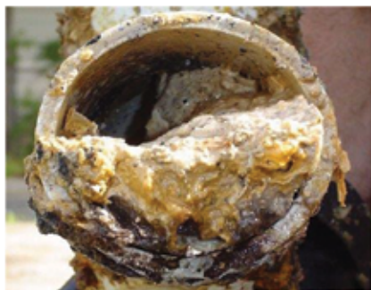
Zamašen kanalizacijski odtok zaradi odvajanja maščob skozi straniščno školjko.

V straniščno školjko ali v odtok ni dovoljeno izliti ostankov maščob in olja. Ne le, da maščobe, ko se ohladijo zamašijo kanalizacijske cevi ampak so prava poslastica tudi za podgane. Maščobo, ki v gospodinjstvu ostane od kuhanja, je potrebno ohladiti in počakati, da se strdi. Strjeno maščobo zavijemo v papir in odstranimo med biološke odpadke.