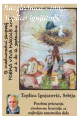
Razglednica - mag Toplica Ignjatovič