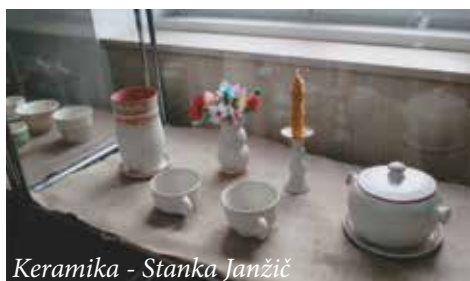
Keramika - Stanka Janžič