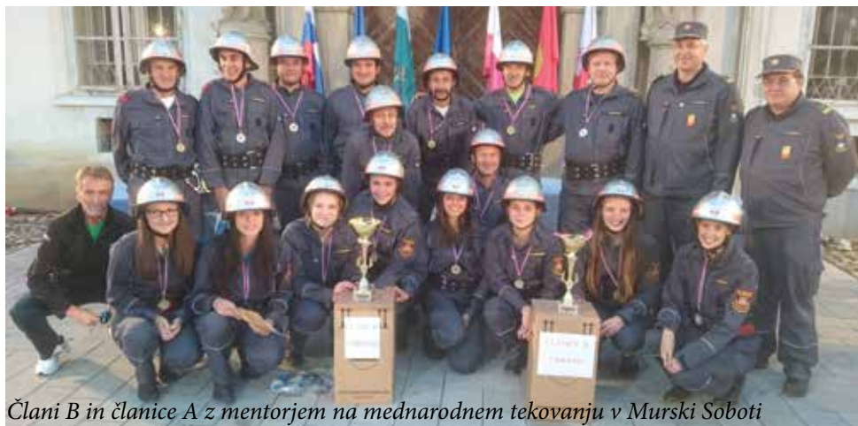
Člani B in članice A z mentorjem na mednarodnem tekmovanju v Murski Soboti