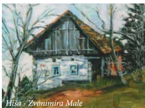
Hiša - Zvonimira Male