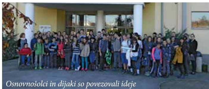
Osnovnošolci in dijaki so povezovali ideje