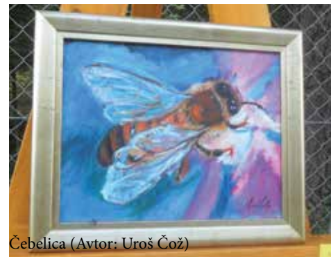
Čbelica (Avtor: Uroš Čož)