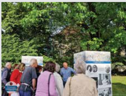
Viktor Ajd, avtor razstave Slovenska Bistrica & Attems med obema vojnama