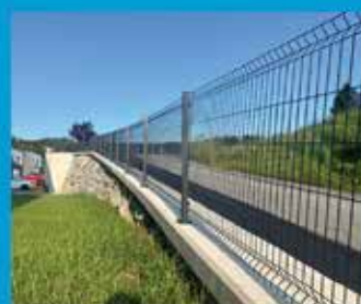
2D IN 3D PANELNE OGRAJE