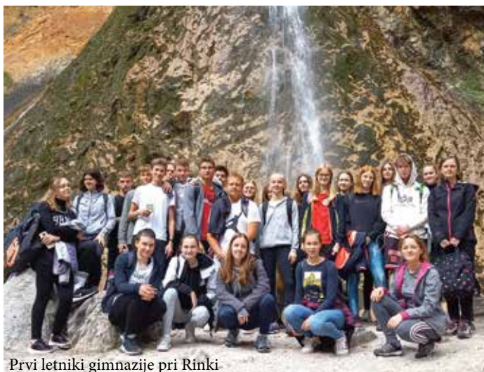
Prvi letniki gimnazije pri Rinki

jakinjam skušali vsaj malo popestriti šolsko delo. Med dejavnostmi, opravljenimi na šoli, pri katerih smo sodelovali tudi z zunanjimi izvajalci, so se v tem tednu zvrstili zdravstveni delavci, čebelarji, inštruktorji vožnje, predstavniki fakultet in trgovci. S športnim dnevom smo krepili orientacijske sposobnosti mladih, ozaveščali dijake o kulturni dediščini Slovenske Bistrice, se poučili o recikliranju in izdelovali nosilne vrečke iz blaga, promovirali branje in krepili povezanost razrednih skupnosti. Ob tem smo izvedli tudi tečaj prve pomoči, teniske vaje in slikovito ekskurzijo v Logarsko dolino.