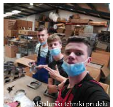
Metalurški tehniki pri delu