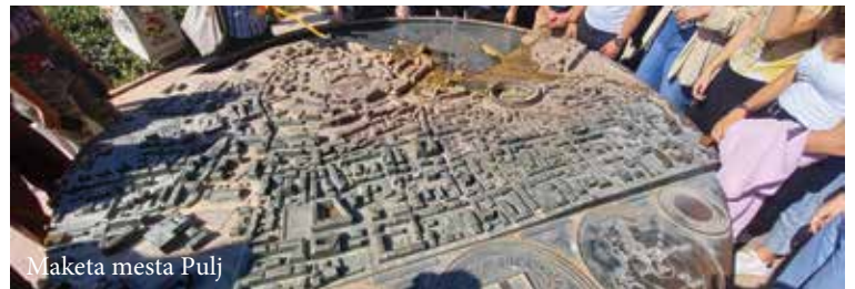
Maketa mesta Pulj