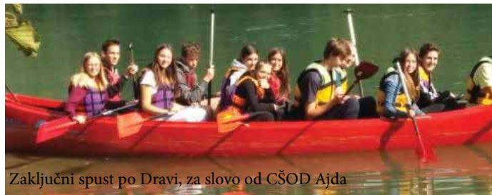
Zaključni spust po Dravi, za slovo od ČŠOD Ajda

jakinjam skušali vsaj malo popestriti šolsko delo. Med dejavnostmi, opravljenimi na šoli, pri katerih smo sodelovali tudi z zunanjimi izvajalci, so se v tem tednu zvrstili zdravstveni delavci, čebelarji, inštruktorji vožnje, predstavniki fakultet in trgovci. S športnim dnevom smo krepili orientacijske sposobnosti mladih, ozaveščali dijake o kulturni dediščini Slovenske Bistrice, se poučili o recikliranju in izdelovali nosilne vrečke iz blaga, promovirali branje in krepili povezanost razrednih skupnosti. Ob tem smo izvedli tudi tečaj prve pomoči, teniske vaje in slikovito ekskurzijo v Logarsko dolino.