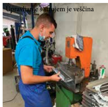
Upravljanje s strojem je večšina