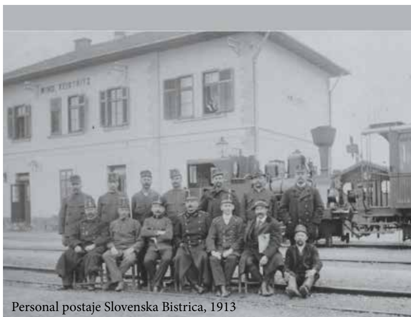
Personal postaje Slovenska Bistrica, 1913