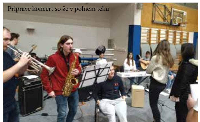
Priprave koncerta so že v polnem teku