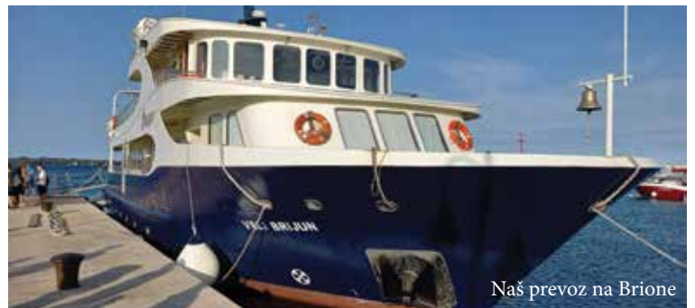
Naš prevoz na Brione

Kot lahko sami vidite, smo novo šolsko leto začeli predvsem aktivno, upamo pa, da ga bomo tako energično lahko tudi zaključili.