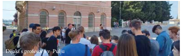
Dijaki s profesorji v Pulju