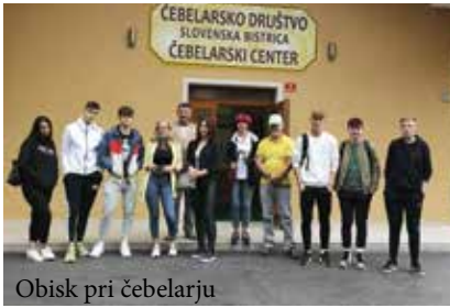
Obisk pri čebelarju

Po dolgem času je tudi bistriška srednja šola zaživela v svoji pravi podobi. Iz učilnic namreč ponovno veje življenje, slišijo se učiteljske razlage, dijaški smeh in pogovori. Ob-