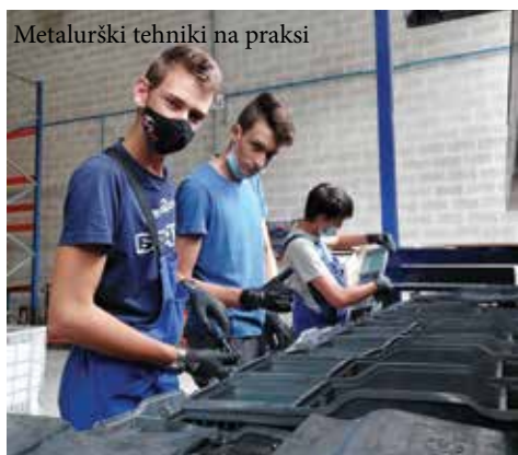
Metalurški tehniki na praksi

Dijaki zaključnih letnikov Srednje šole Slovenska Bistrica so konec novembra obiskali virtualni karierni sejem za bodoče študente. Tedensko lahko poslušajo videopredstavitve posameznih fakultet. Na voljo so individualna svetovanja, sejem Informativa v januarju 2022 ter informativni dnevi v februarju.